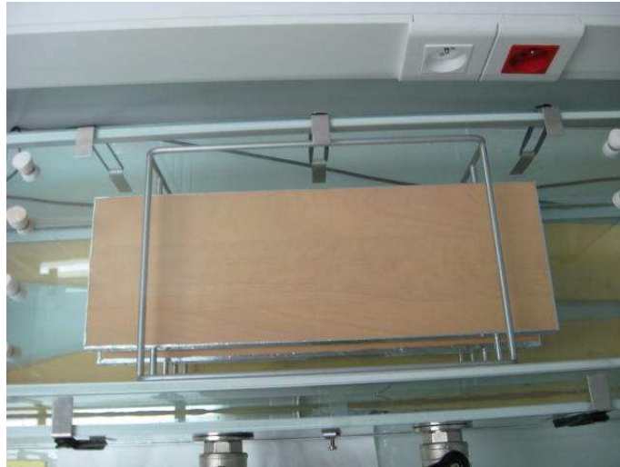
Photo 3 : Epruvettes conditionnées dans la chambre d'essai d'émission / Test pieces in emission test chamber

Les conditions de l'essai ont été sélectionnées selon les recommandations de la norme NF EN ISO 16000-9 / Test conditions have been chosen according to NF EN ISO 16000-9 (tableau 2 / table 2 ).