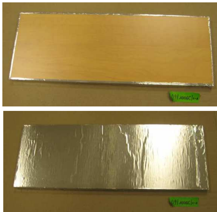
Photo 2 : Exemple d'éprouvette d'essai après colmatage / Test piece example after sealing